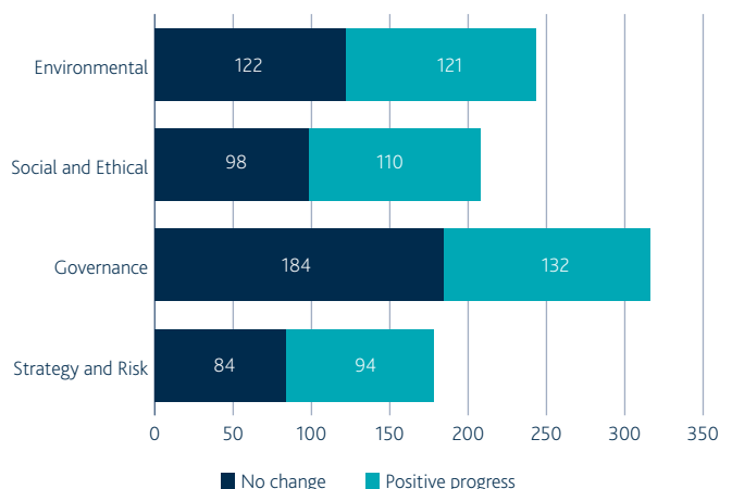
Engagement-Fortschritte im Jahr 2018

In 2018 haben wir mit 746 Unternehmen zu insgesamt 2.084 Themen und Zielen Dialog geführt. Dabei machten wir gute Fortschritte und erreichten im Jahresverlauf für rund die Hälfte unserer Ziele mindestens den nächsten Meilenstein. Die folgende Abbildung zeigt, welche Fortschritte beim Erreichen der für die einzelnen Engagements festgelegten Meilensteine erzielt wurden.